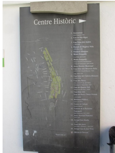
Cartell deteriorat pel pas del temps