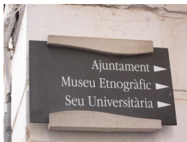
Exemple de cartelleria antiquada

Adjuntem reportatge fotogràfic de la cartelleria que cal renovar.